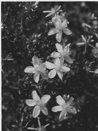
Johanniskraut-Extrakte sind auch von der Schulmedizin anerkannt.

PROF. WILLICH: Unter „Integrativer Medizin“ verstehen wir die Kooperation von Schulmedizin und Komplementärmedizin inklusive der etablierten alternativmedizinischen Richtungen. Wir halten dies für dringend notwendig im Sinne einer bestmöglichen Behandlung des Patienten. Bisher sitzt er oft zwischen den Stühlen und geht entweder zum Schulmediziner, der nichts von der alternativen Medizin wissen will, oder zum Alternativmediziner, der ihm wiederum von der Schulmedizin abrät. Und dieser Dualis-